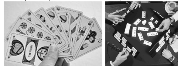
Zusammenarbeit. Im Dezember 2019