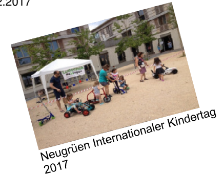
Neugrüen Internationaler Kindertag 2017