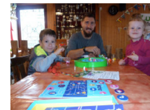
MEGA - 17