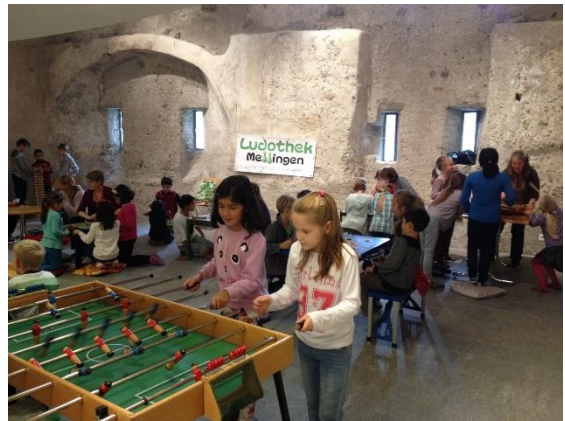
Spielnachmittag in der Bibliothek

Neben den Aktivitäten und dem normalen Tagesgeschäft wurden einige Stunden im Hintergrund gearbeitet, die für unsere Kunden nicht immer direkt sichtbar sind. Dank des einmaligen Gemeindebeitrages konnten wir die Ludothek farblich auffrischen und alte Gestelle ersetzen. Während der Frühlingsferien wurde geräumt, geputzt und geschraubt, wobei wir auch Unterstützung von unseren Männern erhielten. Viel Zeit benötigt der Spieleeinkauf, gilt es doch zu forschen und zu rechnen damit das Budget möglichst optimal eingesetzt werden kann. Danach Spiele einkaufen, anschreiben, fotografieren und die Home-Page aktualisieren. Dank des Gemeindebeitrages konnten wir einen Teil vom Spielsortiment auffrischen und aktualisieren und somit unseren Kundenbedürfnissen entsprechend anpassen.