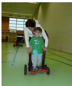
MUKI - Turnen